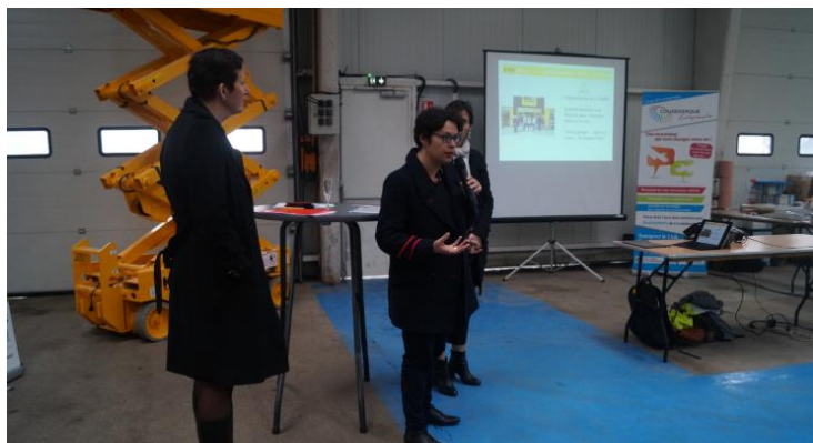
« Les jeudis de la RSE » à Coudekerque-branche : intervention du CREPI

Jeudi dernier, le CREPI était convié à participer au « jeudi de la RSE » au sein de l'agence Kiloutou de Coukerque-branche.